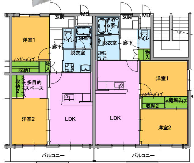
中部屋 占有面積 60.76㎡ ※バルコニー除く バルコニー面積 7.44㎡ 角部屋 占有面積 60.40㎡ ※バルコニー除く バルコニー面積 8.52㎡

取引態様/仲介 所在地/出雲市渡橋町 242-1、242-3 交通/JR 出雲市駅...約 3km 教育機関/四絡幼稚園...徒歩 11分 四絡小学校...徒歩 12分 第三中学校...自転車15分 (2.7km) ※選択校区 その他/ラピタ本店...徒歩 8分 ローソン市役所前店...徒歩 8分 コスモス渡橋店...徒歩 5分 島根中央信用金庫...徒歩 4分 JAしまね...徒歩 10分 諸費用/敷金 2ヵ月分 礼金 1ヶ月分 家財保険加入必須 (2年更新) 仲介手数料 賃料 1ヶ月+消費税