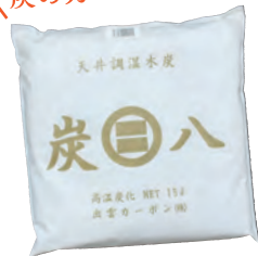
調湿木炭「炭八」天井用